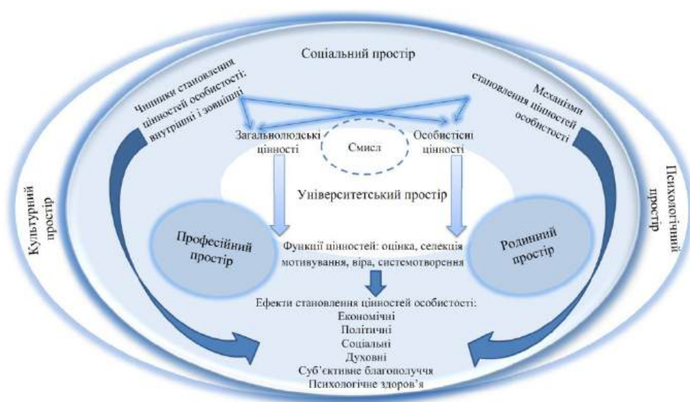
Рис. 1.2. Модель становлення цінностей особистості

не тільки як зовні заданих альтернатив, але і досягнутого потенціалу саморегуляції як внутрішньої динаміки руху мотивів, цілей і смислів. Якщо припустити, що особистісні цінності виступають специфічною формою функціонування смислових утворень в особистісних структурах, то можна вказати їх психологічні корені: вони формуються і проявляються саме в актуальній регуляції рішень суб'єкта про його переваги. Так, особистісні цінності функціонують як певний рівень розвитку або актуалгенезу смислових утворень особистості. Перехід від особистісних смислів до особистісних цінностей передбачає здійснення суб'єктом спеціальної активності одночасно пізнавального й особистісного характеру, оскільки у ній важко розвести окремо когнітивні й особистісні зусилля, спрямовані на освоєння людиною свого внутрішнього світу. Отже, можна стверджувати, що становлення особистісних цінностей пов'язане з динамікою процесів усвідомлення, що включають різні види вербалізації і зміщення пізнавально-особистісних зусиль на власну смислову сферу. Це становлення включає як мінімум дві складові – утворення особистісних смислів та особистісних цінностей. Уявлення про формування смислових утворень невід'ємні від аналізу реальної життєдіяльності особистості і вже традиційно пов'язані з такими моментами динаміки смислоутворення, як ієрархізація мотивів, вирішення завдань щодо смислу, особистісні вибори, особистісний конфлікт [1; 5].